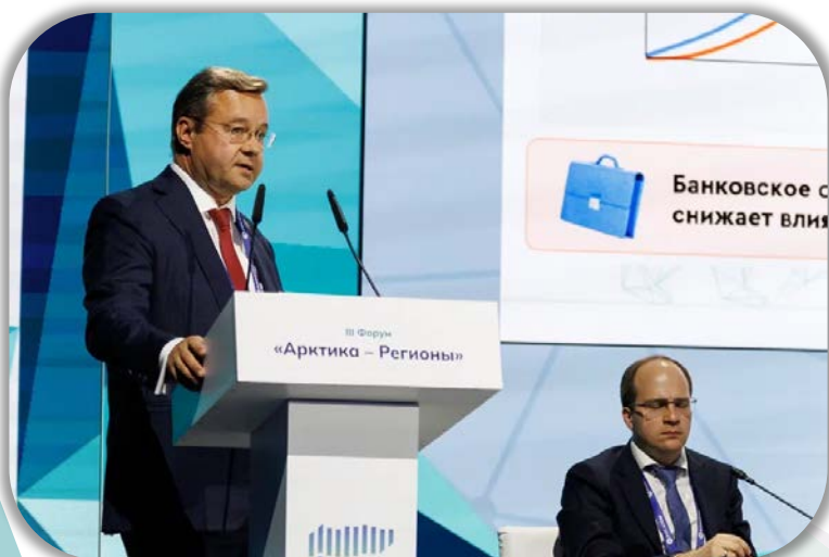
Пакеты участия «VIP» / «ДЕЛЕГАТ ПРЕМИУМ» / «ДЕЛЕГАТ»